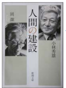
小林秀雄 岡潔 新潮文庫 (362円/税別)

近代評論の礎を築いた日本文学界の巨人・小林秀雄。かたや、多変数解析関数論の分野において独創的な業績を残した世界的数学者・岡潔。この2人がそれぞれの観点から、学問、芸術、文学、科学、思想、そして日本人の情緒ということについて語り合った貴重な対談本。文学者と数学者の対談といえば、対照的な異分野交流と考えられがちだが、豊富な知識と研ぎ澄まされた感性を持ち、その道を究めた2人の天才の言葉は、決して平行線では終わらない。書中、印象的だったのは、「人は極端に何かをやれば、必ず好きになるという性質を持っています。好きにならぬのがむしろ不思議です。好きでやるのじゃない、試験目当てに勉強するというような仕方は、人本来の道じゃないから、むしろそのほうがむずかしい」という言葉だ。脳科学者の茂木健一郎は『あとがき』において、本書の魅力を実にうまく述べている。「二人の『知の巨人』の思考パターンのようなものが、肉体に染み込んでくる。その結果、自分が少しだけ賢くなった気分になる」と。まさしくその言葉通り、次代を担う若者にとっては必読の一冊である。