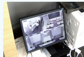
受付にモニターを設置